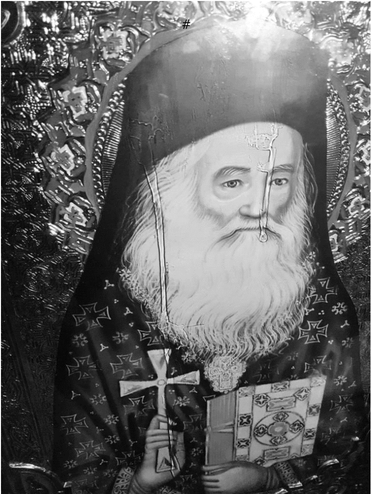
Icoana făcută Sfântului (necanonizat) Justin Pârvu de evlavia populară, asemenea celor făcute în trecut Sfântului Daniil Sihastru ori Sfântului Nectarie din Eghina, care a plâns pe 19 martie 2019 la Iași